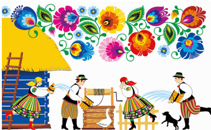
czyli Niedzielę Zmartwychwstania Pańskiego.